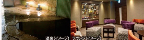
温泉(イメージ) ラウンジ(イメージ)