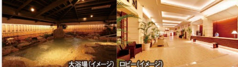
大浴場(イメージ) ロビー(イメージ)