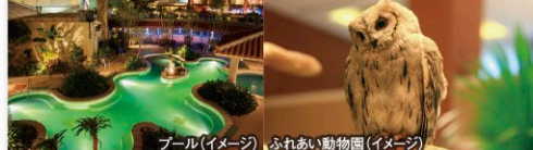
プール(イメージ) ふれあい動物園(イメージ)